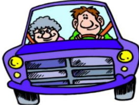
drive a car