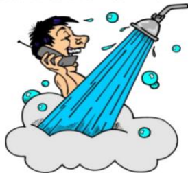
take a shower