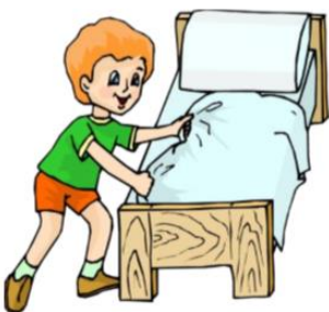
make the bed