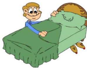
go to bed