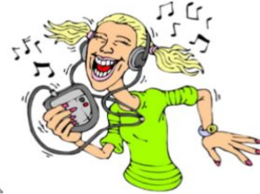
listen to music