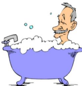
have a bath