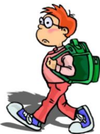
go to school