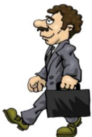
go to work