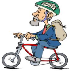
ride a bicycle