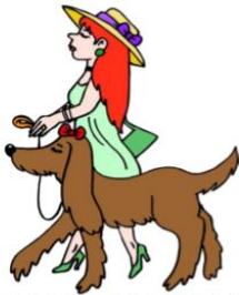
walk the dog