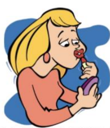
put on makeup