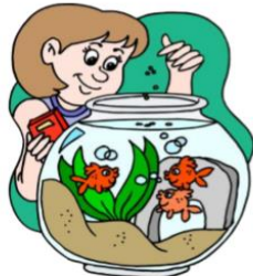
feed the fish